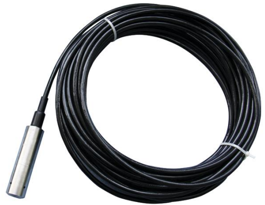
一体式液位变送器